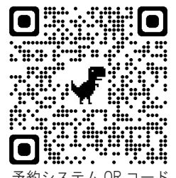
予約システムQRコード

*参加者対象プログラムは、当日先着順です。1階オリエンテーションルーム入口で、プログラムの開始10分前から受け付けます。